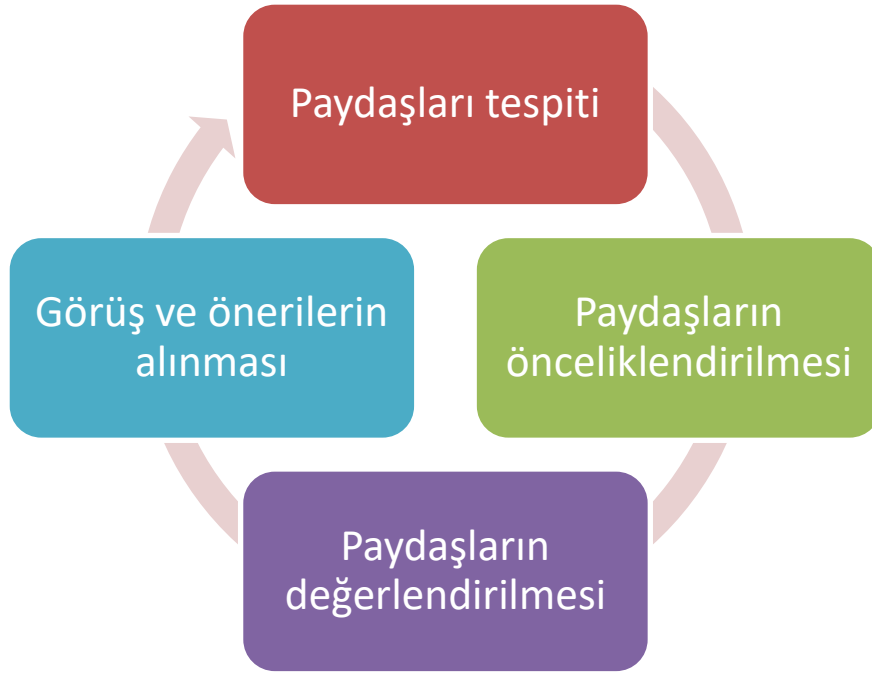
Şekil 2. Paydaşların Tespit Süreci

Kurumumuzun faaliyet alanları dikkate alınarak, kurumumuzun faaliyetlerinden yararlanan, faaliyetlerden doğrudan/dolaylı ve olumlu/olumsuz etkilenen veya kurumumuzun faaliyetlerini etkileyen paydaşlar (kişi, grup veya kurumlar) tespit edilmiştir.